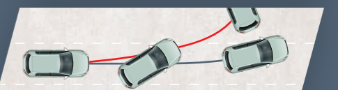
ELECTRONIC STABILITY CONTROL SYSTEM (ESC)