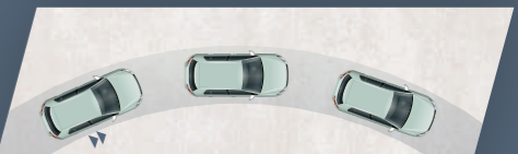
ELECTRONIC BRAKEFORCE DISTRIBUTION (EBD)